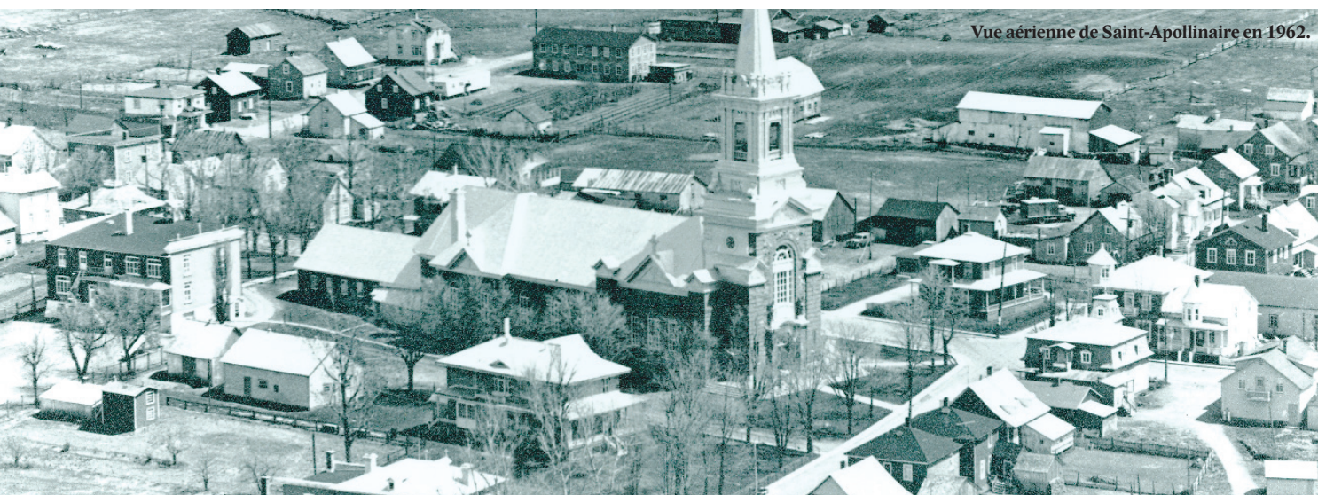
Vue aérienne de Saint-Apollinaire en 1962.

En 1919, le village et la paroisse se divisèrent, le village se nommant Francoeur. L'actuelle municipalité de Saint-Apollinaire résulte de la fusion des deux entités en 1974.